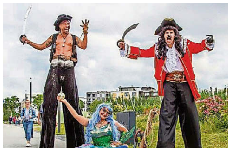
Im Griespark in Volketswil die Fantasy-Welten erleben.

Das Fantasy-Festival ist besser als jeder Film, denn es geht nicht darum, lediglich zu konsumieren, sondern die Geschichten auch