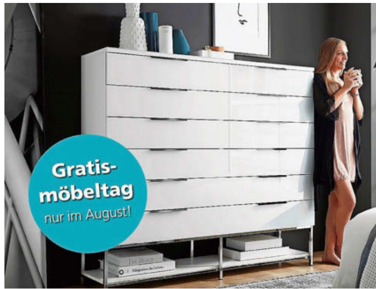
Im August kann man bei Diga so richtig profitieren.

Diese einzigartige Aktion gilt auf das gesamte Sortiment – vom komfortablen Boxspringbett über den massiven Holztisch bis zur bequemen Gartenlounge. Der ermittelte Gratistag wird ab Freitag,