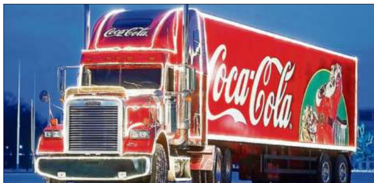
Vor dem Truck können auch Fotos gemeinsam mit Santa geschossen werden.